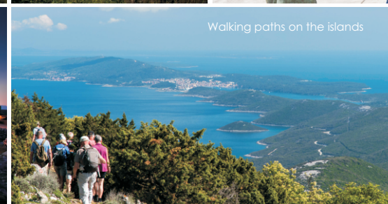
Walking paths on the islands