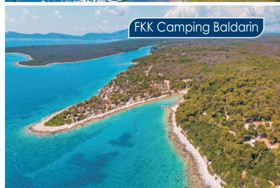
FKK Camping Baldarin